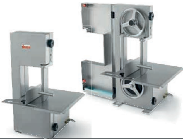
SO 1650-1840 Start