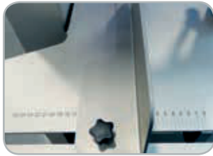
Scala graduata sul piano di lavoro