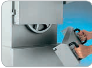
Cassetto raccolta scarti facilmente estraibile per la pulizia

Removable wastage tray for easy cleaning.