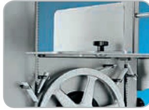
Raschiatori lama in materiale plastico alimentare ad innesto rapido. Flangia in materiale plastico alimentare nero a tenuta stagna per protezione motore

Removable wastage tray for easy cleaning.