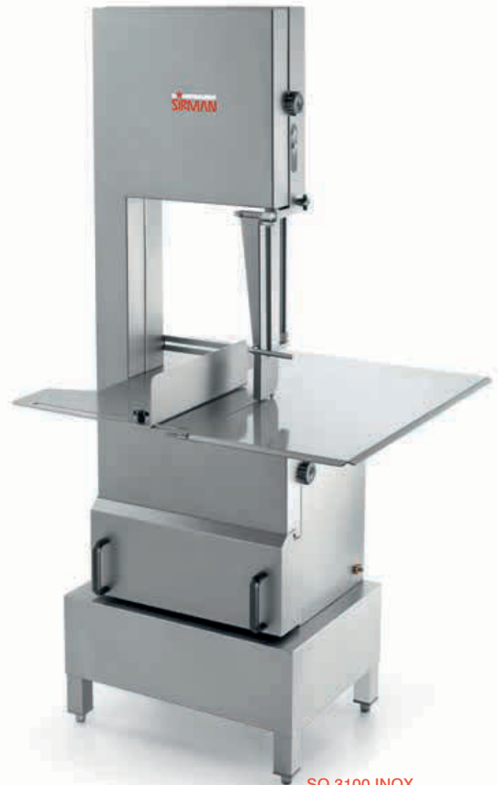
SO 3100 INOX