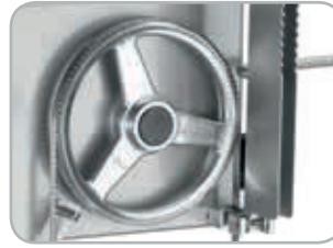
Pulegge superiori ermetiche

Alimentary plastic blade scraper in quick to insert. Watertight black plastic flange to protect the motor