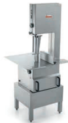
SO 2400 INOX SX