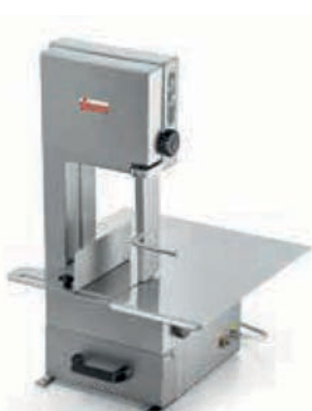
SO 1650 INOX