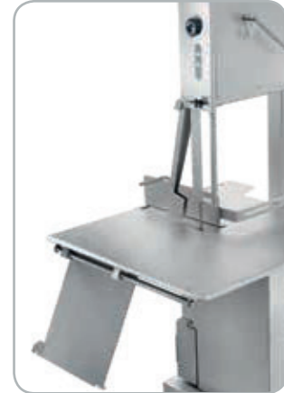
Piano scorrevole opzionale ribaltabile