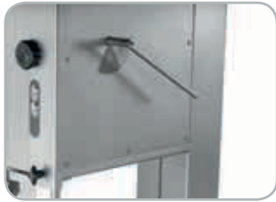
Tensionamento lama automatico