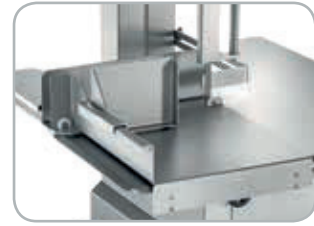
Piano scorrevole opzionale