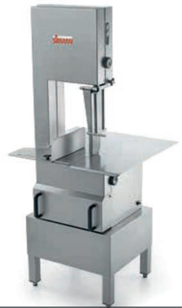
SO 2400 INOX