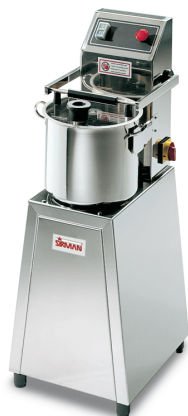
Sirman 粉碎机, model Cutter C15:

Sirman Spa Viale dell'Industria 9/11 35010 PIEVE DI CURTAROLO (PD), Italy Tel./Fax. +39 049 9698666 / +39 049 9698688 email: info@sirman.com