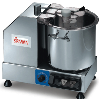
Sirman 粉碎机, model Cutter C6:

Sirman Spa Viale dell'Industria 9/11 35010 PIEVE DI CURTAROLO (PD), Italy Tel./Fax. +39 049 9698666 / +39 049 9698688 email: info@sirman.com