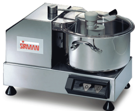
Sirman 粉碎机, model Cutter C4:

Sirman Spa Viale dell'Industria 9/11 35010 PIEVE DI CURTAROLO (PD), Italy Tel./Fax. +39 049 9698666 / +39 049 9698688 email: info@sirman.com