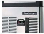
正面开/关按钮 故障报警功能