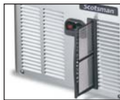
可拆卸的冷凝器滤网