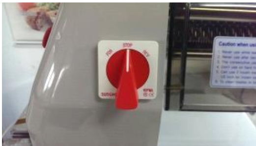
2. 啟動時插 110V 的電