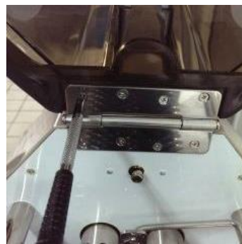
4. 再將投入口組上壓克力罩即可