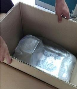
1. 打開箱子，先把內層箱取出，方便把機器拿起來