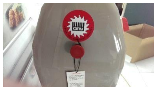
4. 此紅鈕為 緊急停止開關 ，按下即斷電。解除時將紅鈕右轉彈出即可。