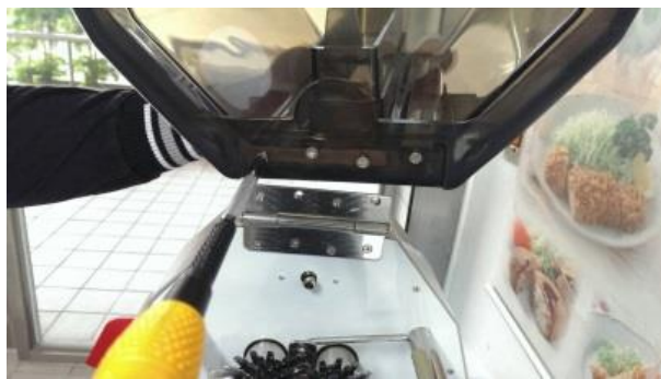
3. 接著把壓克力罩上的四顆螺絲旋下，鎖在機器的門栓上