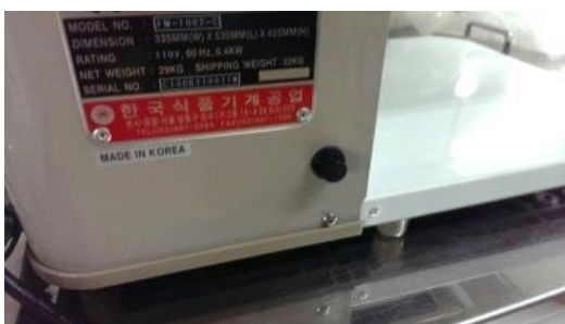
3. 黑鈕為保險絲開關