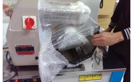
2. 取出機器包裝內下方的壓克力上罩