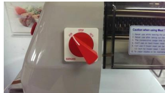
1. 將旋扭開關左轉，即可使用， 右旋是逆轉 ，如掉入異物可右旋回轉上來